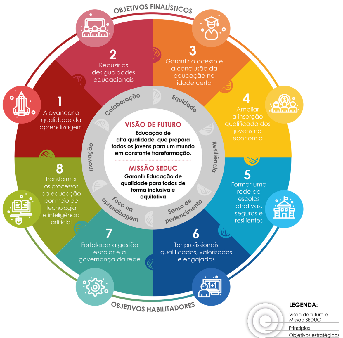
Figura 1 - Mandala da Agenda da Educação 2025-2035

A Missão da Secretaria Estadual da Educação é “Garantir Educação de qualidade para todos de forma inclusiva e equitativa”. Sendo assim, os objetivos da Agenda da Educação 2025-2035 são direcionados para uma educação de qualidade, inclusiva e equitativa, alinhada aos desafios e demandas da sociedade. Os objetivos são divididos em finalísticos e habilitadores e cada um possui metas. Os objetivos habilitadores visam a criar condições de gestão e organização, incorporando novas tecnologias e inteligência artificial. Já os objetivos finalísticos descrevem, de forma qualitativa, os principais resultados relacionados à visão de futuro da SEDUC-RS. As metas mobilizadoras incluem ter todos os segmentos da educação avaliados pelo Índice de Desenvolvimento da Educação Básica (IDEB) entre os 3 melhores do país e mais de 90% dos jovens com oportunidades de educação e trabalho.