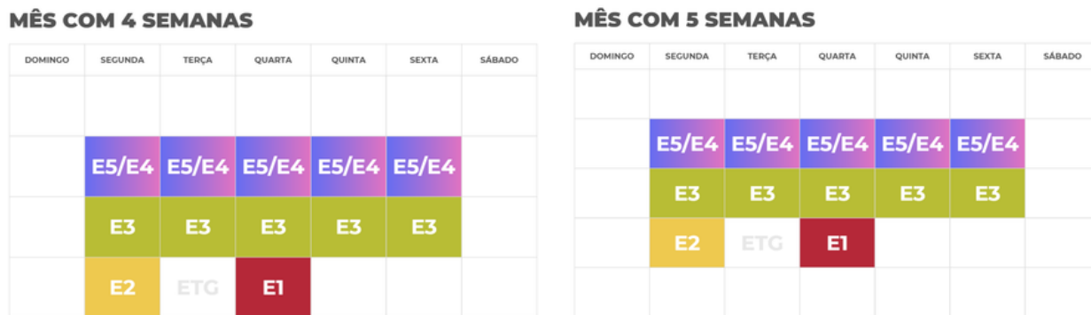
Figura 6 - Instâncias participantes em cada reunião