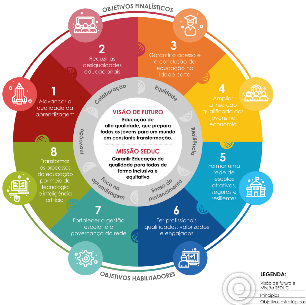
Figura 1 - Mandala da Agenda da Educação 2025-2035

Sendo assim, os objetivos da Agenda da Educação 2025-2035 são direcionados para uma educação de qualidade, inclusiva e equitativa, alinhada aos desafios e demandas da sociedade. Os objetivos são divididos em finalísticos e habilitadores e cada um possui metas associadas. Os objetivos habilitadores visam criar condições de gestão e organização, incorporando novas tecnologias e inteligência artificial. Já os objetivos finalísticos descrevem, de forma qualitativa, os principais resultados relacionados à visão de futuro da Secretaria de Educação do Rio Grande do Sul.