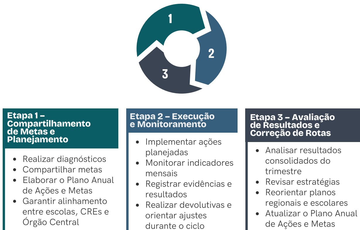
Figura 3 - O PDCA no Ciclo de Governança da Educação

Compartilhamento de Experiências: Processo de troca de práticas, aprendizados e soluções entre escolas, CREs e Órgão Central ao longo de todo o ciclo.